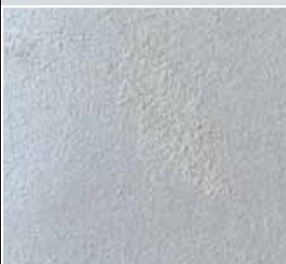
Untergrund viola 2