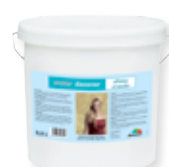
effetto cristallo im Farbton kristallsilber