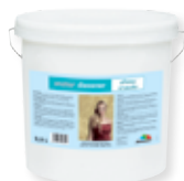
effetto cristallo im Farbton kristallsilber