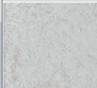
Untergrund azzurro 2