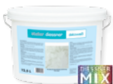
dekoweiß im Farbton weiß, grigio 1, grigio 2