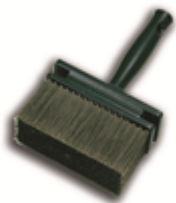
Pinsel PV 09