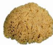
Naturschwamm PV 32