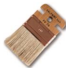
Pinsel PV 76